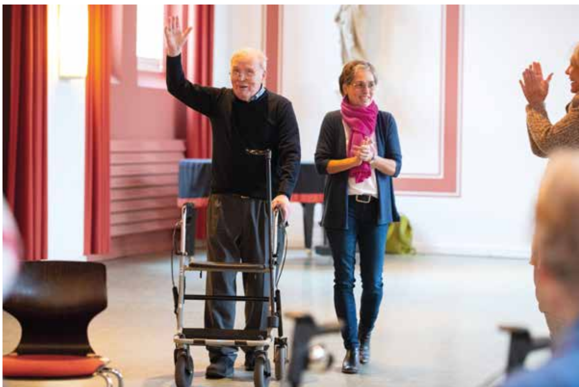
Applaus macht gute Laune!

Fürsorge für die oder den anderen, während die Person mit Demenz immer stärker Empfangende von Unterstützung und weniger in Entscheidungsprozesse eingebunden wird. Ebenso verändern sich die Kommunikation und der Austausch miteinander, was von beiden Seiten als belastend erlebt wird. Fast immer kommt es zu einer Fokussierung auf die Defizite, die sich durch eine Demenz einstellen. Dabei gerät aus dem Blick, was weiterhin miteinander gelingt oder welche Potenziale sich neu öffnen. Da sich die demenzbedingten Veränderungen im Alltag nur bedingt ausgleichen lassen, braucht es vom Alltag losgelöste Konzepte, die Lust machen, sich diese gemeinsam zu erschließen.