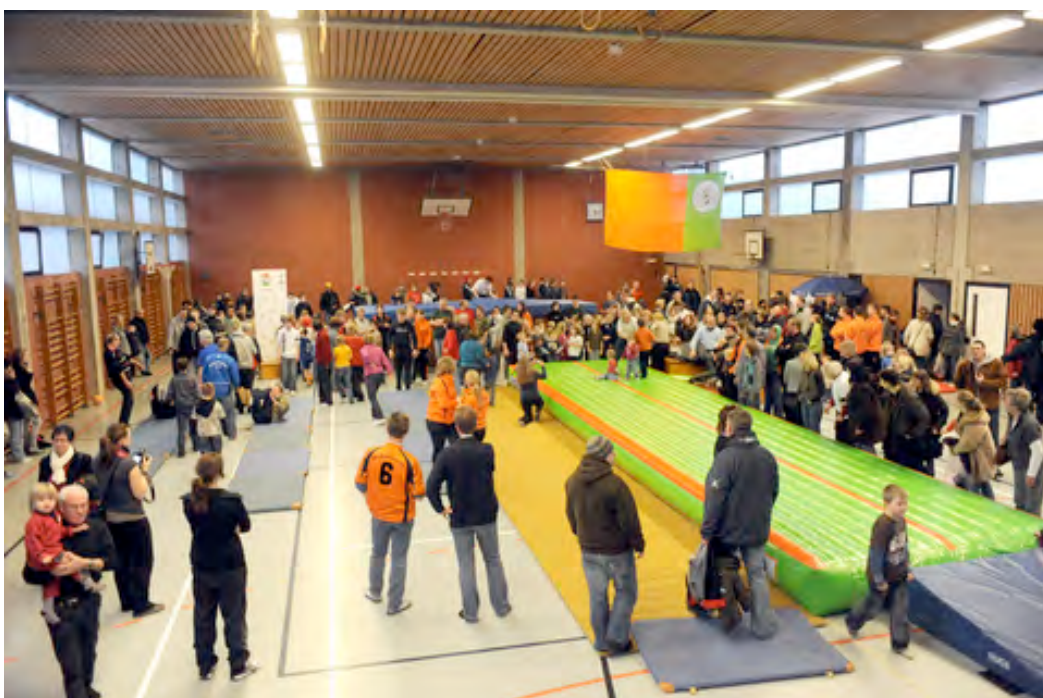
Leherheide in Bewegung