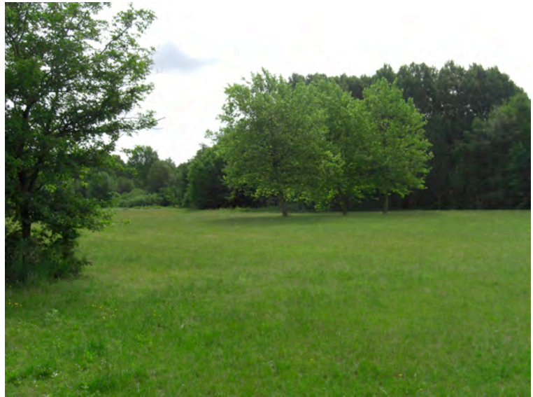
Ferdinand-Lassalle-Str. | hier standen einige Plattenbauten, die bis heute als für Leherheide(-West) typisch gelten

„Leherheide ist grün.“ „Natur!“ „Freundlich.“ „Sehr offen.“ „Sauber.“ „Schön & grün.“ „Schön ruhig.“ „Hier kann man gut leben.“ „Was ich brauche, ist hier.“ „Nette