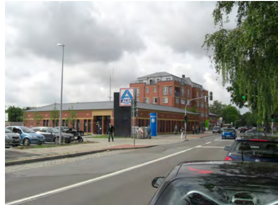
Hans-Böckler-Str. | Mitte

„Kriminalität ist gering – Statistik ist rückläufig.“ „Polizei muss nachts hier sein!“