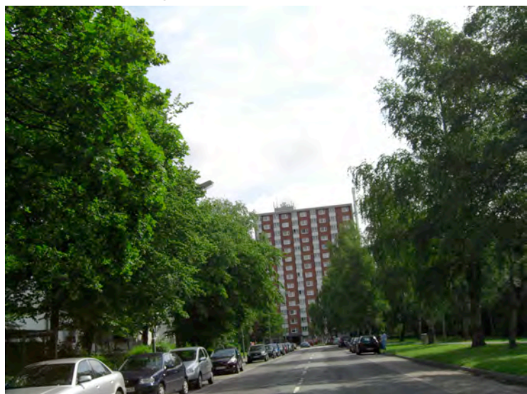
Hans-Böckler-Str. | die Hauptstraße in Leherheide

„Dörflich – man kennt sich.“ „Leherheider bleiben eher im Stadtteil.“ „... bei uns in Leherheide.“ „Ältere Menschen leben möglichst lange im eigenen Heim.“