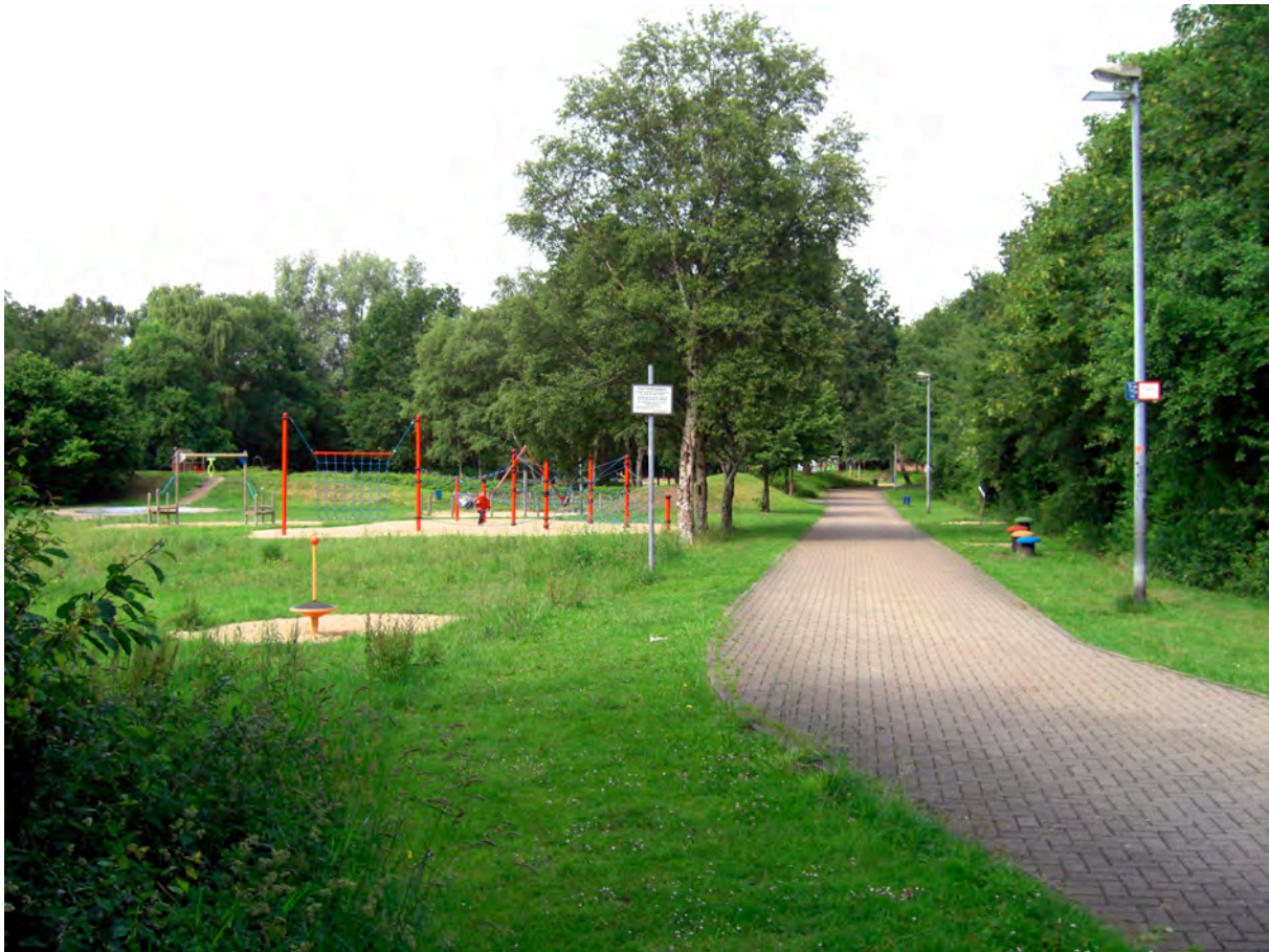
Spielpark Leherheide | Eingangsbereich

Das Bad 1 ist ein städtisches Schwimmbad, das nicht als Teil des Stadtteils wahrgenommen wird. Dies wird durch die Randlage des Schwimmbads unterstützt.