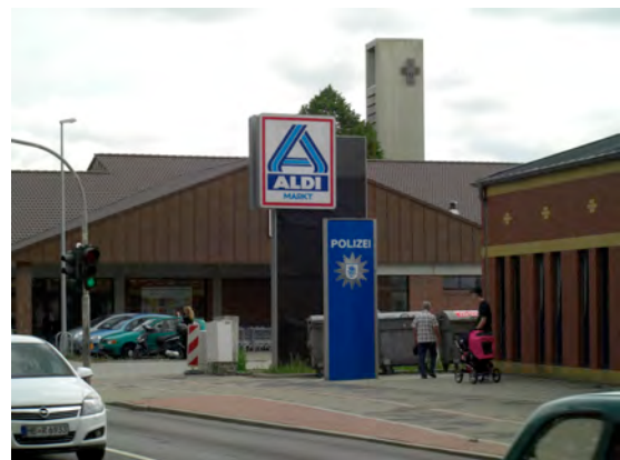
Hans-Böckler-Str. | Mitte

„Das neue Zentrum ist gut.“ „Neue Mitte!“ „Julius-Leber-Platz: Ältere Leute saufen da am Wochenende nachts und lassen alles stehen.“ „Viele Läden.“