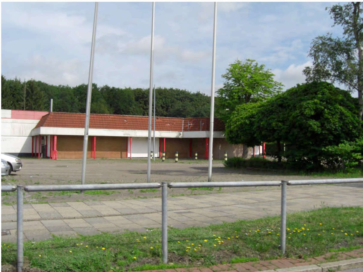
Hans-Böckler-Str./Mecklenburger Weg | Leerstehendes Geschäft in schlechtem Zustand